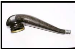
Fig N° 1 Vue de coté