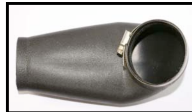
Fig N°5 Vue de dessous