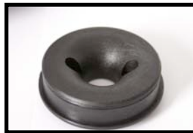
Fig N°2 Bride de fixation sur le carburateur