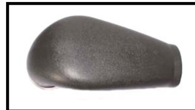
Fig N°3 Vue de dessus