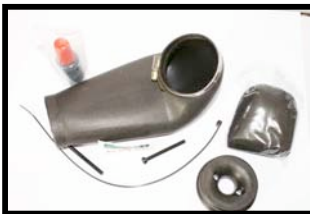
Fig N°1 Vue d'ensemble