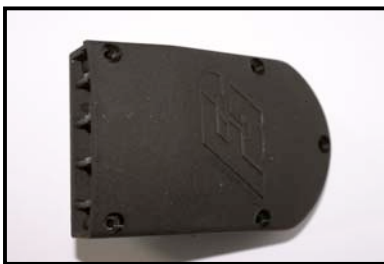
Fig. N°1 vue de dessus