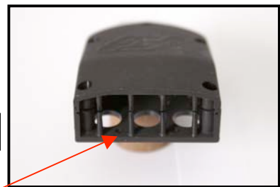
Fig.N°2 Vue Avant