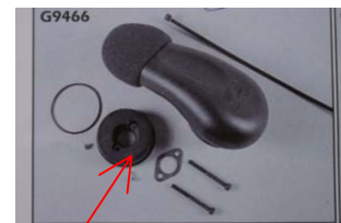
Photo 1 bride simple