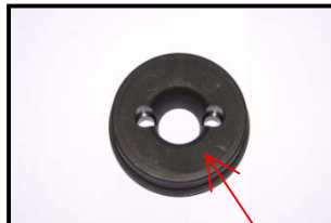
Fig. 4 Bride simple