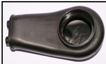
Fig. 2 vue de dessous