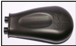
Fig. 1 Vue de dessus